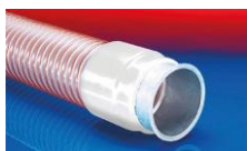
CONNECT 243 FOOD