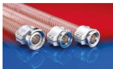
CONNECT SAFETY CLAMP ASSEMBLY 231