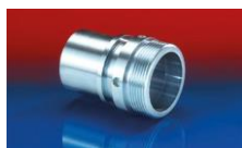
CONNECT THREAD FITTING 234