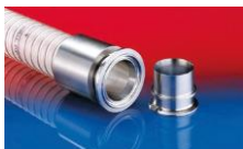
CONNECT PRESS ASSEMBLY 232