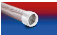
CONNECT 245 FOOD